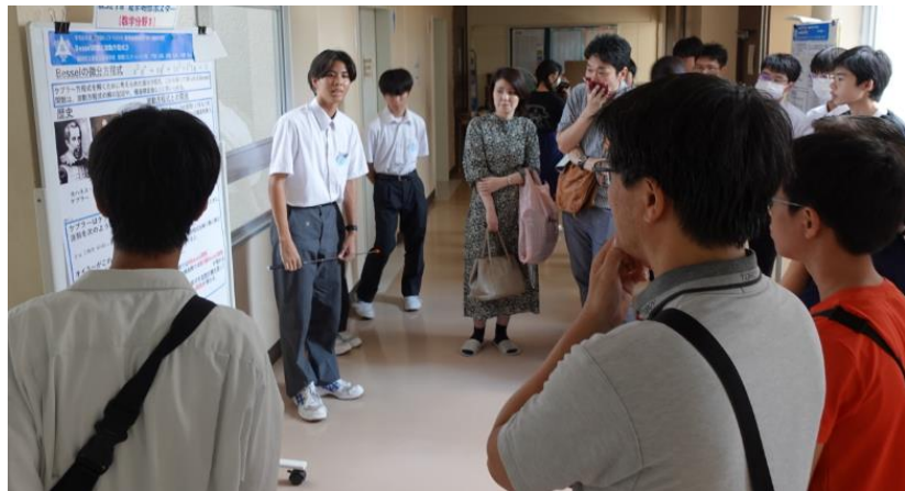
当日の発表の様子

8月に行われた夏季研修で学んだことをまとめた総括ポスター発表を行いました。1年生にとって初めてのポスター作成、発表であり、作成には各班に担当の3年生がついて指導しました。発表練習では、2、3年生がアドバイスするなど、縦のつながりを大切に数コミの伝統を繋げていきます。