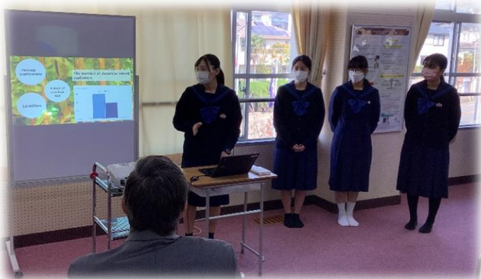
マスクをしても伝わるよう、工夫しました!